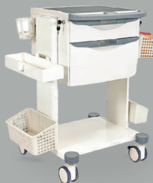
Тележка медицинская универсальная MET SIY-220

НКМИ 202390 Тележка медицинская универсальная