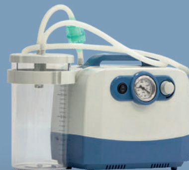
Отсасыватель медицинский хирургический переносной MET OX-190