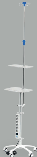
Стойка инфузионная для внутривенных вливаний MET FM-160

НКМИ 187150 Стол для осмотра/терапевтических процедур, с питанием от сети