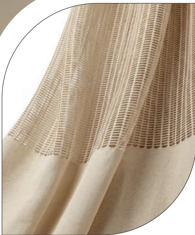
Штора медицинская антибактериальная MET ЕРУЛ Г004-00110-00/04088194 НКМИ 184200