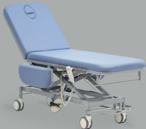
Стол медицинский универсальный модульный для осмотров и процедур MET KS-610