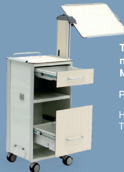
Тумба медицинская с принадлежностями MET TL-130

НКМИ 182530 Система аспирационная для хирургии