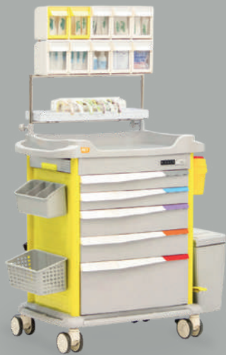
Тележка медицинская универсальная с сервисным модулем MET PSC-160

НКМИ 131950 Стойка для внутривенных вливаний